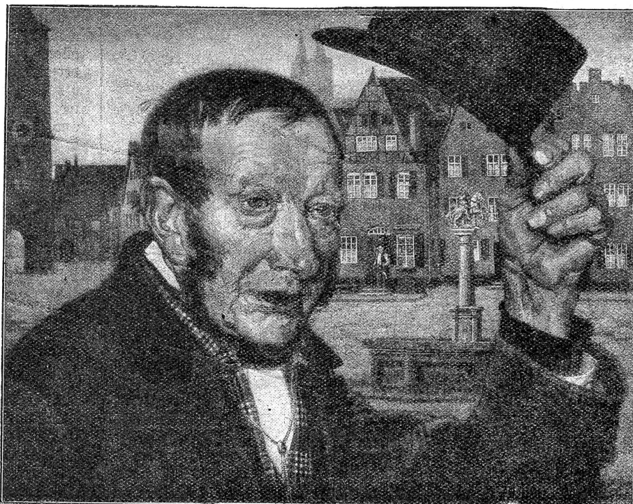
Grüß Gott! Nach einem Gemälde von Peter Philipp.

Als aber Zukundus sein Verzeichnis anzuschwärzender Biederleute hervorzog, ihr sagte, um was es sich handle, in wessen Name und Auftrag er gekommen, und sie ziemlich trocken und kurz zu fragen begann, was sie von jedem wisse oder was sich tun lasse, um denselben als Bösewicht in das verdiente Gerücht zu bringen und zur Strafe