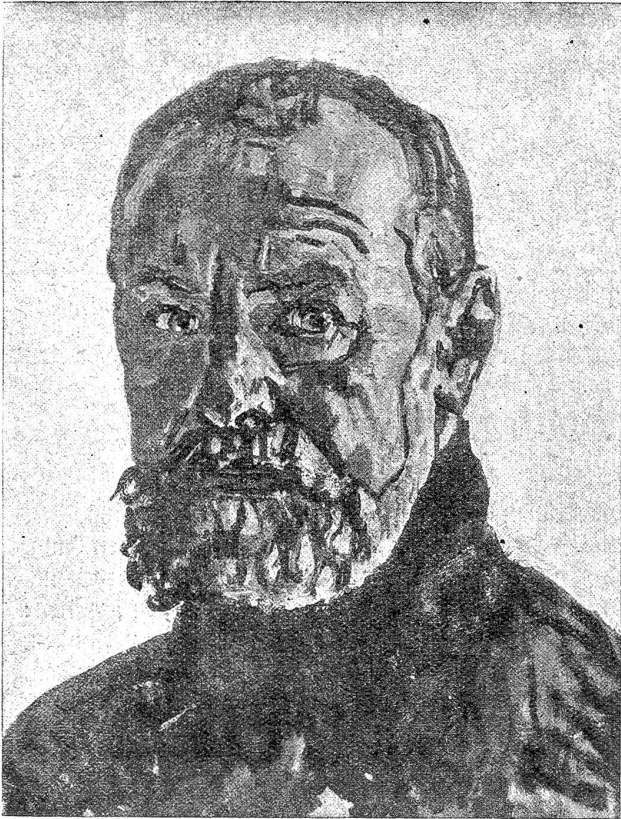
S. Hodler. Selbstbildnis 1917.

Räudigen und ging täglich mit Leuten, die er früher, wie man zu sagen pflegt, nicht mit einem Stecklein hätte anrühren mögen.