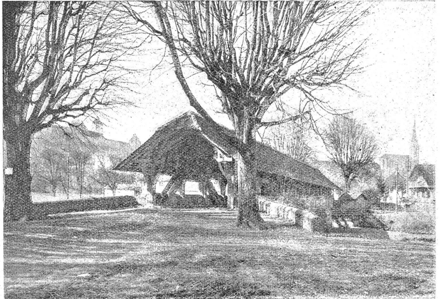
Die Wynigenbrücke bei Burgdorf.

breitete sich von hier aus nach und nach auch über die anderen Länder. Da man die Krankheit nicht zu behandeln verstand, sie aber sehr erblich war, half man sich durch die Erbauung von Siechenhäusern. Das Kloster St. Gallen muß schon im 8. Jahrhundert ein Siechenhaus besessen haben. Nach einer Verordnung der Äbtissin am Fraumünster in Zürich bestand das Siechenhaus zu St. Jakob an der Sihl im Jahre 1291. In Basel siedelten die Sonderjischen im Jahre 1286 vom St. Leonhardsberge an ihre neue Behausung zu St. Jakob an der Birs. In Solothurn bestand im 14. Jahrhundert ein Siechenhaus mit einer kleinen Kapelle. Bern erbaute zu Anfang des 13. Jahrhunderts ein Siechenhaus, das anlässlich der Belagerung der Stadt durch Rudolf von Habsburg im Jahre 1288 verbrannte, bald aber wieder aufgebaut wurde und zwar beim Obstberge in der Gemeinde Muri. Es wurde auch mit einer kleinen Kapelle versehen. Dieses Siechenhaus wurde 1601 mit dem Blatternhaus vereinigt. Man scheute die Siechen sehr. Das beweist eine Verordnung der Berner Regierung vom Jahre 1493: „Die Sonderjischen sollen nicht mehr in die Stadt kommen, um zu betteln, sondern man soll alle Wochen einen gefunden Mann auf einem Röcklein mit einer Schelle in die Stadt schicken, um Almosen einzusammeln“. Anderwärts mußten die Siechen einen besondern Mantel tragen, daß sie allen Leuten kenntlich waren, auf daß man ihnen aus dem Wege gehen könne. Auf jeden Fall hatten die „Sonderjischen“ und Leprosen ein trauriges Leben.