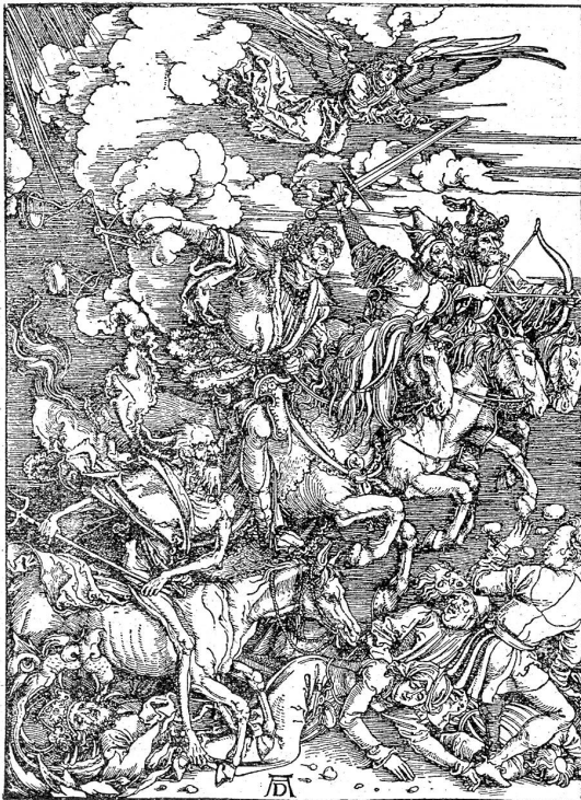
Die apokalyptischen Reiter. Zeichnung von Albrecht Dürer.

lungen über Musik und Gymnastik, wie er eine Proportionslehre geschrieben hat, so verfaßte er auch eine Schrift über