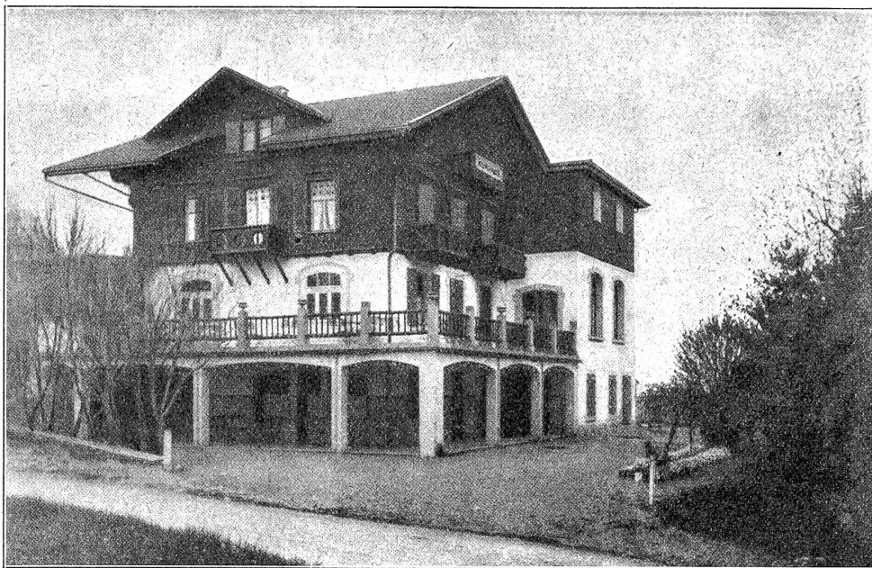
Zur Einweihung des Taubstummenheims für Männer in Uetendorf. Ansicht von der Offseite.

Wer allerorten unverständlich Und schmerzlich eingeeengt in Banden, Dem gönnet einen eignen Hort, Wo er mit seinesgleichen plaudern Und sich verstehn mag ohne Zaudern: Denn auch der Taube lebt vom Wort.