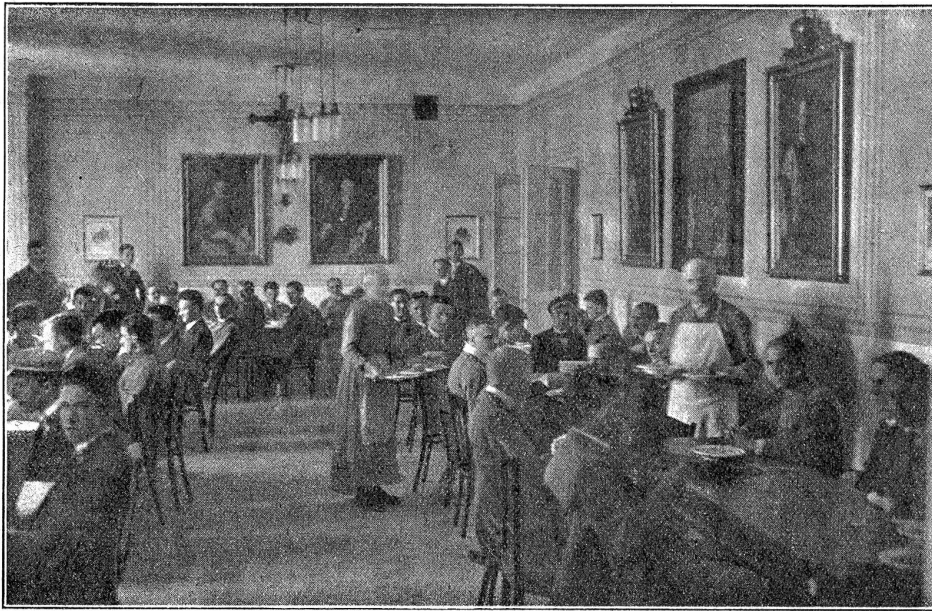
Blick in ein Speiselokal des Schweizer. Hilfskomitees für die hungernden Völker, an der Habsburggasse in Wien.

Natürlich, da haben wir wieder so ein Urteil eines „Augenzeugen“. Wer mit dem heiteren Blick eines Ferienbummlers oder wohl gar mit dem wohngefüllten Herzen eines Jungvermählten, am Arm seines glückstrahlenden Weibchens durch die Rärntnerstraße schlendert, die glänzenden Juwelierläden mustert und mit dem Kraftbewußtsein eines Valuta-Athleten — so nennt man in Wien die glücklichen Besitzer von Schweizergeld — seine Einkäufe besorgt; wer sich vormittags durch die prunkvollen Säle der Kaiserschloßer führen läßt, nachmittags im Schönbrunner- oder Bellvederepark oder im Prater lustwandelt, abends im weichen Parterresitz der Staatsoper den Parzival genießt, oben drauf im Café Sacher bei einem duftenden Mokka und umschmeichelt vom süßen Gewoge der Wienerwalzer Wiener Nacht leben studiert, um hernach im komfortablen Fremdenzimmer des Palace Hotels sein müdes Haupt zur Ruhe zu legen — der wird von der Not der Wiener keine starken Eindrücke mit nach Hause nehmen. Er läßt sich sagen, daß es auch vor dem Kriege viele Bettler gegeben habe vor den Kirchenportalen und an den Straßenecken. Er gewöhnt sich rasch an die Krüdenmänner ohne Arme und Beine, die da am Begrande und auf den Türschwelle sitzen, und an die Edensteher mit den Täfelchen „Kriegsblind“, deren Müßdöschen so eindringlich um ein Almosen flehen. Er füllt sich für diese Unvermeidlichen die Rocktasche mit den unbequemen Kronenscheinen, die man ja sowieso gerne los wird. —