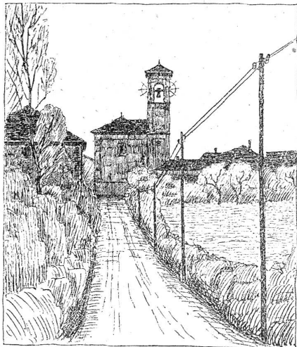
Bei Ligornetto, Cessin.

Wenn wir die Entwicklung des Heimatschutzgedankens in seinem Einfluß auf das Bauwesen verfolgen, so sehen wir, wie man anfangs hauptsächlich das Gebäude als Einzelobjekt im Auge hatte. In den letzten Jahren geht man weiter: Man tritt ein für die Erhaltung ganzer Städte- und Dorfbilder, und beim Entwerfen von Bebauungsplänen nehmen architektonisch-ästhetische Erwägungen immer mehr den ihnen gebührenden Platz ein; Städtebau steht heute im Vordergrund des Interesses. Mit den abseits der Ortschaften liegenden Land- und Feldstraßen aber hat sich der Heimatschutz bis jetzt noch wenig befaßt, mit Unrecht, denn