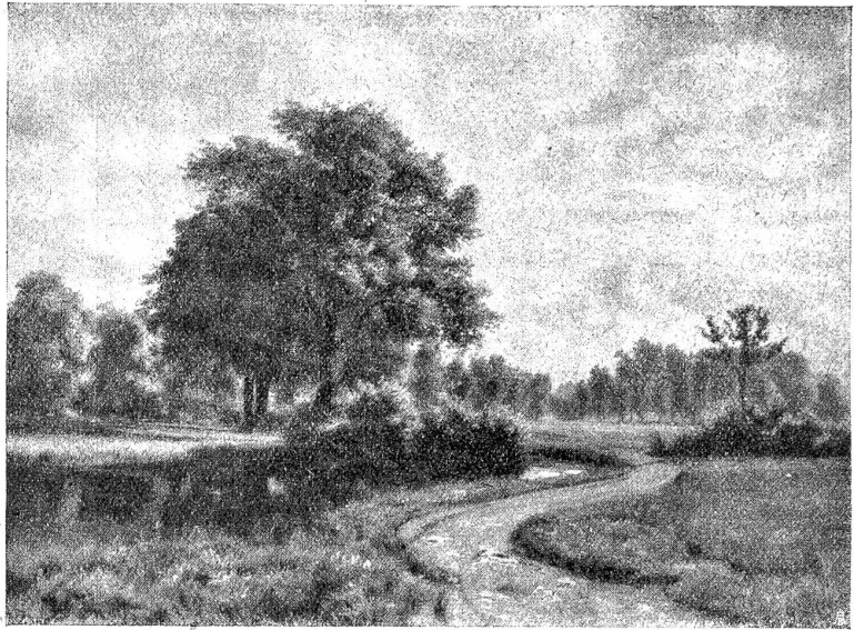
Wiesenweg, einem Wasserlaufe folgend.

In Deutschland wählt man oft Obstbäume zu Straßenbäumen. Speziell mit großen, hochstämmigen Arten, mit Nuß- und Kirschbäumen, erreicht man auf diese Weise sehr gute Wirkungen. Vor dem Kriege schwankte in Deutschland der Ertrag der Obstbäume zwischen 40 und 80 Mark per