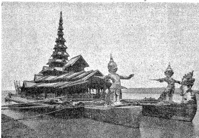
Barken des letzten Königs von Birma.

derbaren Blumen und Springbrunnen.“ Sofort bekommt er den Ort seiner Tätigkeit lieb. Er sichtet 83 große Zinf-