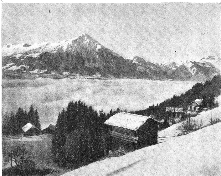
Reibemeer über dem Chunersee mit Blick auf die Riesenkette.

Als er jedoch abends, ein bißchen angeraucht, wie er schmunzelnd zu dem lachenden Bethli sagte, vom Taufschmaus heimkam und eben über den zwanzigmal gelesenen Marienkalender einnicken wollte, wurde behutsam die Türe aufgetan und Portiunkula, seine ältere Tochter, trat hüftelnd, wie ein kalter Luftzug, in die Stube. „Guten Abend!