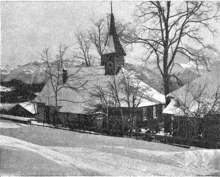
Das Kirchlein auf dem Beatenberg im Winterkleid.

Der Schreiner Gagelmann jedoch, und die große Dummheit, erzählten die Leute, seien am andern Morgen noch mutterseelenallein in der Wirtschaft auf ihren Stühlen gesessen, so wie sie am vorhergehenden Mittag sich hingesetzt hätten, und haben zusammen ein schmunzelndes Niderchen getan. Der Schreiner habe dabei noch im Schlafe seine Mähchen gemacht. Als er aber am Morgen mit seiner Riesendame mit einem Riesenkater erwacht sei, habe er gleich wieder zu trinken und zu fetten angefangen, als ob er sich eben erst zum Hochzeitsmahl gesetzt hätte. Rätcherli hätte ihm getreulich, und über seine weinseligen Sprüche an einemfort auflachend, Gesellschaft geleistet, bis sie in später Nacht endlich miteinander ins Hochzeitsbette gesegelt seien, geführt und bewacht von dem vielraffigen Pips.