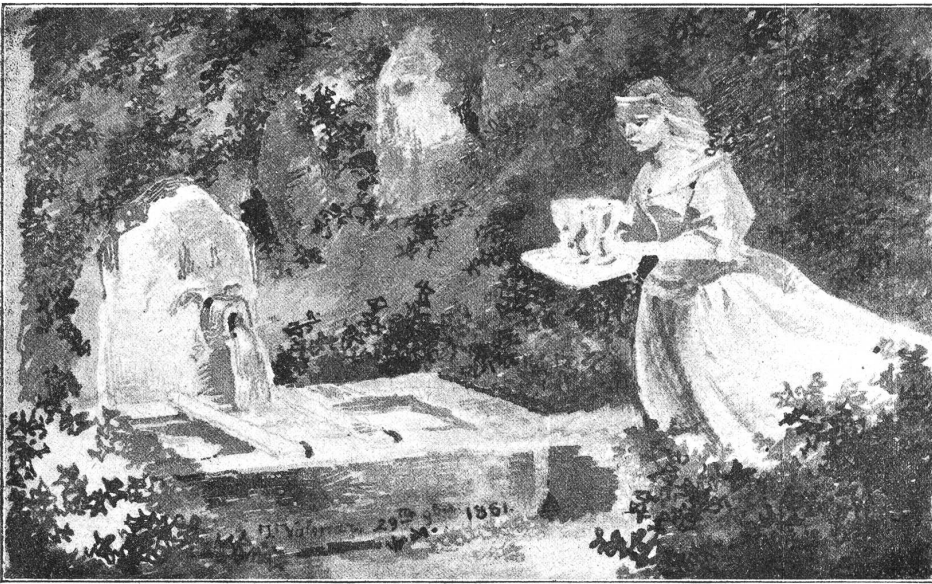
Das Edelfräulein beim Glasbrunnen.