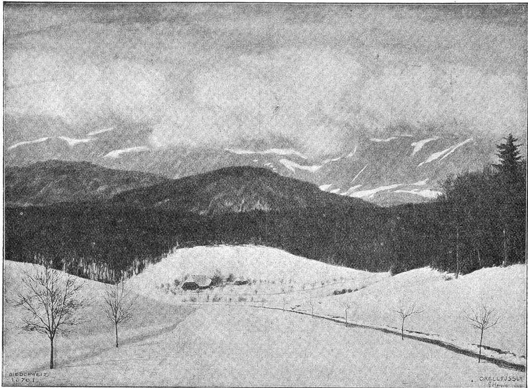
E. Herzig: Winterlandschaft