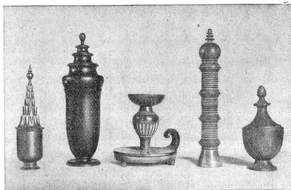
Zum 5. Wettbewerb der Verkaufsgenossenschaft des Schweizerischen Heimatschutzes.

Jedem Besucher der Berner Landesausstellung steht noch der Dörfli-Bazar in gutem Angedenken. Dort wurde zum erstenmal der Begriff „Heimatschutz-Reiseandenken“ festgelegt und in Beispielen, wenn auch vielleicht nicht immer in absolut überzeugenden, vordemonstriert. Ein Reiseandenken muß mit dem Land und den Leuten, an die es erinnern soll, in irgend einem, wenn möglich innern Zusammenhange stehen. Es soll irgendwie die Eigenart der Landschaft oder deren Bewohner, ihren Charakter, ihre Sitten und Gebräuche oder ihre Arbeit wiedergeben. Es soll, wenn immer möglich, ein Gebrauchsgegenstand sein, damit der Käufer nicht einen Wust von wertlosen Nippes aufspeichert, wenn er Reiseandenken sammelt. Dazu verlangt man von Reiseandenken Solidität