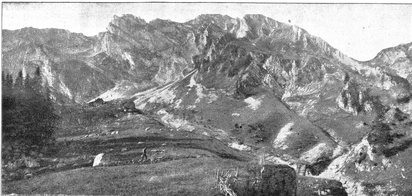
Das Einzugsgebiet der Blattenheidquellen.

An diese Trinkwasseranlage ist ein kleines Kraftwerk angeschlossen, das das Gefälle der Leitung von zirka 600 Metern bei Blumenstein ausnützt. Die heutige Technik ermöglicht eine solche Ausnützung, ohne daß dadurch die Qualität des Wassers, das also auch zuerst durch Turbinen strömt, ehe es in die Verteilungsleitung gelangt, herabgesetzt würde. (Vergl. Abb. auf S. 236.)