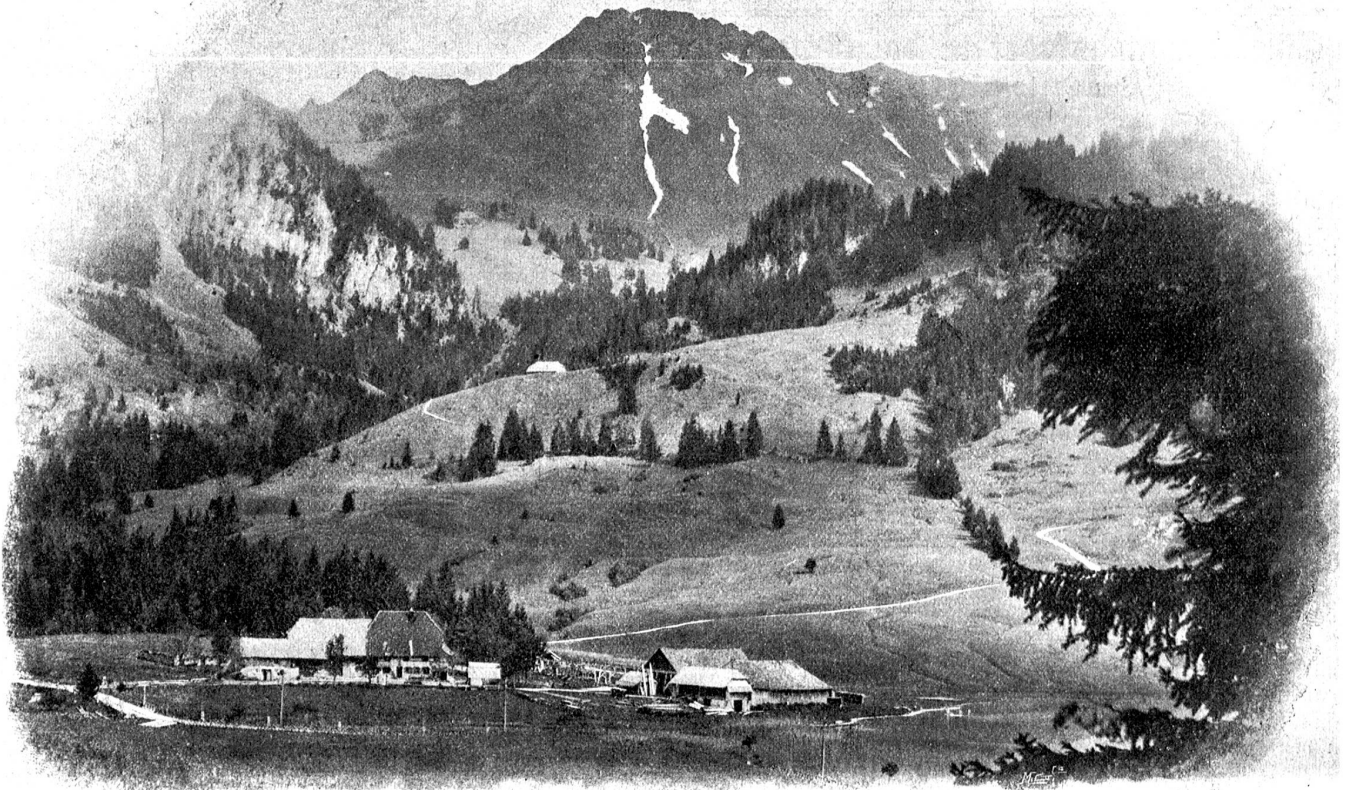
Die Gipsera am untern Ende des Schwarzsees./

fiel, sahen wir einander an — und lachten! Und ich hinkte nicht mehr, und alle Müdigkeit schien verschwunden! Auf dem andern Ufer der Savroz ließen wir uns am Wege nieder und verzehrten wohlgenut das karge Abendbrot. Mir aber war's sonderbar leicht ums Herz, und ich sang so laut, daß es die Karthäuser in allen Zellen und Kapellen hören mußten — dann nahmen wir ein weiteres Stück Weg unter die Füße und zogen nach Charmey. Die Betglocken von Cerniat und Crésuz drüben an der Berglehne tönten melodisch in den hellen Frühlingsabend!