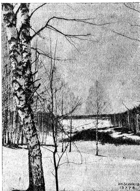
Aus der Umgebung von Jassnaja Poljana. Birkenwälder, wie sie für die russische Landschaft typisch sind.

Er bekennt sich zur Anarchie. Seine Welt, in sich geschlossen und von allen Menschen anerkannt, würde freilich Gesetze überflüssig machen. „Anarchie heißt nicht das Fehlen aller Institutionen, sondern nur das Fehlen von Institutionen, denen sich zu unterwerfen die Menschen durch Gewalt gezwungen werden. Nur solche gelten, denen die Menschen sich aus freien Stücken, aus Vernunft fügen. Es scheint, als ob eine Gesellschaft von vernunftbegabten Wesen anders nicht sein könnte.“