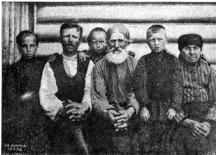
Bauerntypen aus der Gegend von Jassnaja Poljana.

und der Welt. Der Kampf gegen das Uebel aber sei Duldung und nicht Widerstand.