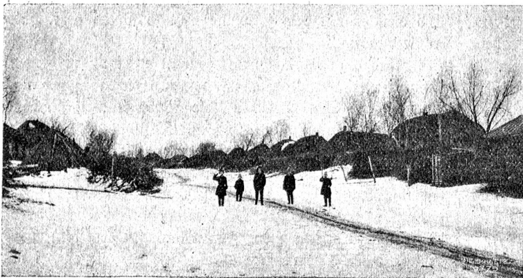
Hauptstrasse von Jassnaja Poljana.

sein mag, es ist durch dies Ereignis allein entschieden, daß er im Tiefsten Nichtkünstler, Kunstfeind von Anfang an sein mußte, und daß all sein Denken und Trachten in der Kunst nur Vorstufe, unreine Vor-Offenbarung des eigentlichen Tolstoi war.