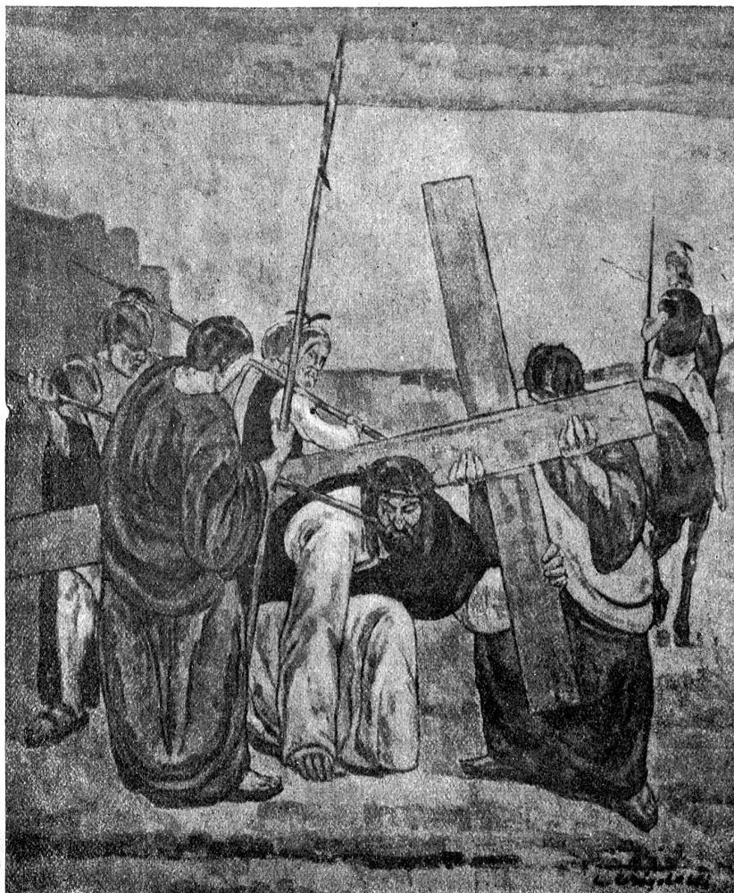
E. Grigoletti: „Kreuztragung“.

Von Zug aus, wo wir — meine liebe Frau und ich — frohe Tage verlebt, machten wir in Begleit unserer Zugerfreunde dem neugegründeten Kindererholungsheim in Unterägeri einen Besuch. In froher Stimmung fuhr die kleine Gesellschaft durch die märzliche Frühlinglandschaft, die romantische Vorzientobelchlucht hinauf ins Aegerital, in dem noch eine leichte Schneedecke lag. An der alten ehemaligen Pfarrkirche des Dorfes vorbei stiegen wir den Hang hinauf, von welchem das stattliche Gebäude des Lungenanatoriums „Adelheid“ heruntergrüßt. Unmittelbar darunter liegt das freundliche „Heimeli“, dem unser Besuch galt. Während des Aufstieges