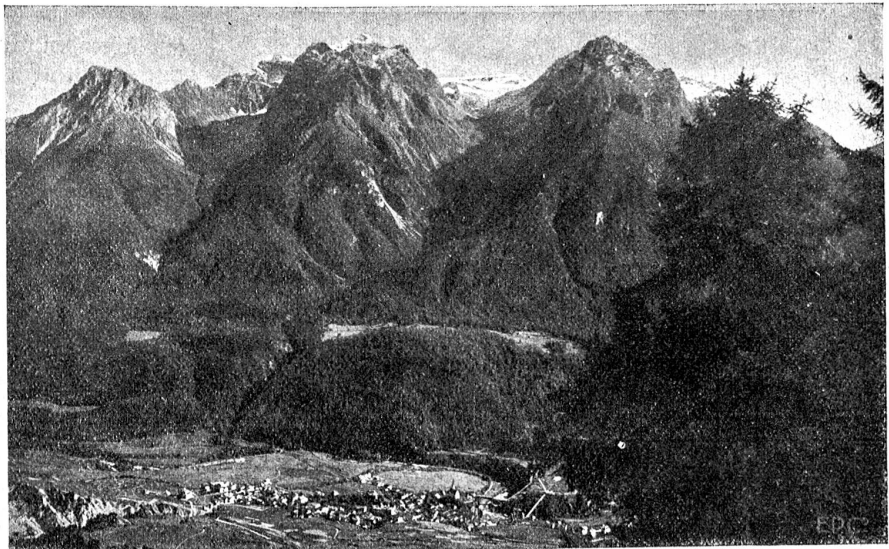
Aus dem Unterengadin: Blick auf die Unterengadiner Dolomiten. Im Talsessel Schuls.

Nationalparkes. Nun treten die Berge näher zusammen, keinen Raum mehr lassend für größere Hochebenen wie im Oberengadin. Eine enge Waldschlucht! Jetzt Süs, wo die Klüelstraße von Davos her mündet. Rasch umfaßt der Blick auf dem rechten Innufer die alten, zerfallenen Ruinen der Burg Chiachinas, die aus der Zeit der Völkerwanderung stammen soll, wo 1799 Secourbe die Oesterreicher schlug. Lavin gegenüber, inmitten dichter, dunkler Fichtenwälder, bettet sich die sogenannte Baldironschlucht, wo 1622 die Bevölkerung vor den mordenden, sengenden und brennenden Scharen Baldirons, des österreichischen Generals, einen sichern Schutzort fand. Noch kurze Zeit: Schon winkt aus der Ferne das Schloß Tarasp, das Wahrzeichen des Unterengadins. Und glücklich „landen“ wir in Schuls-Tarasp, der vorläufigen Endstation.