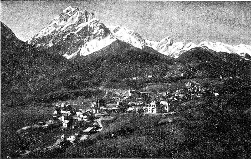
Aus dem Unterengadin: Schuls mit Piz Pisoc.