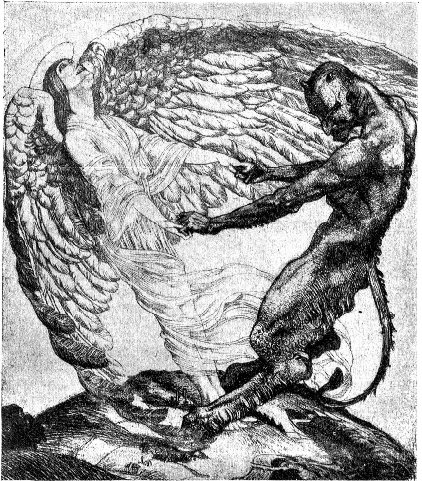
Sritz Gilsli, St. Gallen: Zwei Mächte.

(Stilische aus dem Kalender „O mein Heimatland“. Verlag Dr. Gustav Grunau, Bern.)