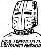
FIG. 9. TOPFHELM M. EISERNEM ABSCHLUS.