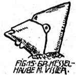
FIG. 15. GR. KESSELHAUBE M. VISIER.

„Ich hab meine Frau ermordet.“ Und er erzählt in hastigen Worten und abgerissenen Sätzen, was er vorhin erlebt hat. „Es kann kein Traum gewesen sein, denn droben sagte meine Frau gerade das, was mir vorhergesagt worden war.“