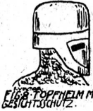
FIG. 8. TOPFHELM M. GESICHTSCHUTZ.