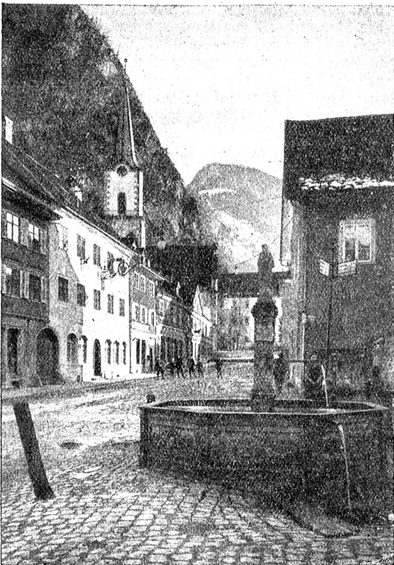
Hohenems , Marktflücken mit 6000 Einwohnern an der Arlbergbahn, am Fuß des Hohen Frejchen (2006 Meter).

Heranziehung billigerer Arbeitskräfte zu helfen, verdanken die Italienerkolonien in Bludenz, Hard und Kennelbach ihre Entstehung. Die Baumwollindustrie hat einzelne Familien reich gemacht. Anders die Stickerei, die große Geldsummen unter die Leute brachte. Im Bregenzerwald, in rein bäuerlichen Gegenden, hat sich die Stickerei als Hausindustrie eingebürgert. So kam es, daß trotz der großen Zahl der in der Industrie Beschäftigten ein eigentliches Proletariat sich nicht bildete. Auch die in der Baumwollindustrie Tätigen betrieben nebenbei fast durchwegs auch eine kleine Landwirtschaft. Der Krieg hat die Industrie lahmgelegt. Ob sie sich jemals wieder erholen wird, das kann niemand sagen.