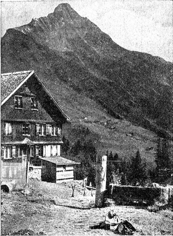
Warth mit Bieberkopf (Vorarlberg).

Das Land Vorarlberg war und ist ein wenig bekannter Winkel des großen Oesterreichs. Neben den anderen Kron-