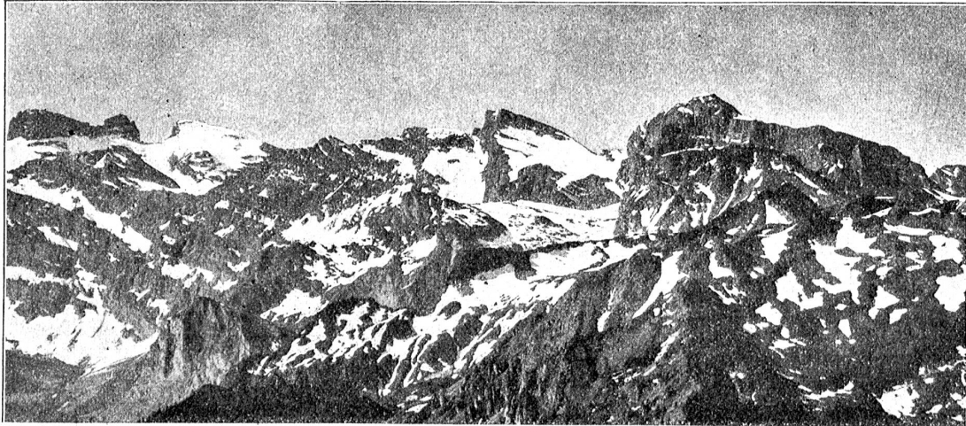
Hutstock und Obwaldner-Alpen vom Stanserhorn aus.

Herrn. Der Schöpfer betrachtete mit strahlendem Angesicht seines Dieners Arbeit und winkte ihm hoheitsvoll zu. Da lachte des Riesen Herz und voller Jubel rief er in den unendlichen Raum hinauf: „Habe ich es Dir recht gemacht, mein Herr und Gott, und bist Du zufrieden mit Deines Dieners Arbeit?“