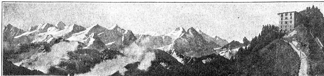
Die Berner-Alpen vom Stanserhorn aus.