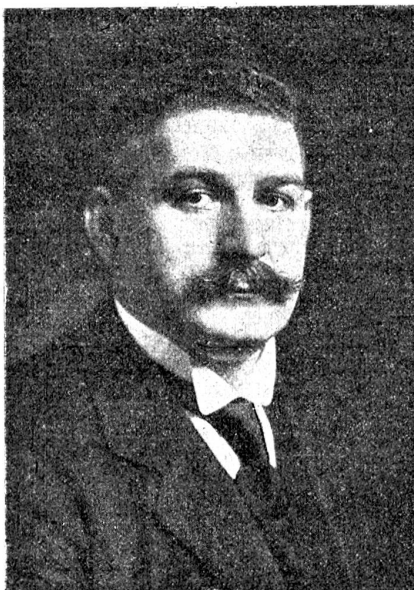
Der neue deutsche Ministerpräsident Gustav Bauer.

mehr, wie wenig die auf Menschlichkeit und Recht beruhenden Wünsche kleiner, jeelich verwandter Volksstämme in der Weltpolitik gewürdigt werden. —