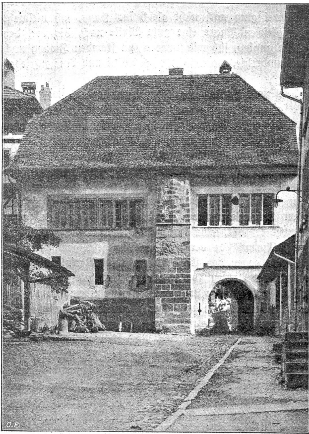
Erlach, das Rathaus, Südanischt.

den Tüden von Haß und Reue, die er sich droben im Wald solange mit Axt und Säge vom Leib zu halten vermochte! Die stärkeren Gefühle des Eroberers, der Ueberwindung aller Hindernisse entbehrten der Standhaftigkeit in dieser gehekten, brünstigen Seele, die so oft schon lahm und wund von ihren Höhenflügen zurückkehrte. Auch jetzt hatte er nur noch ein Bedürfnis: sich, wie's gerade kam, einzuspinnen in jegliches Behagen seines Alltags, seiner nächsten Umgebung. So war Heinrich Anderegg. Leicht begeistert, schnell verzagt — ein Held im Morgenrot, ein Bettler oder Brigant im Abendgraun.