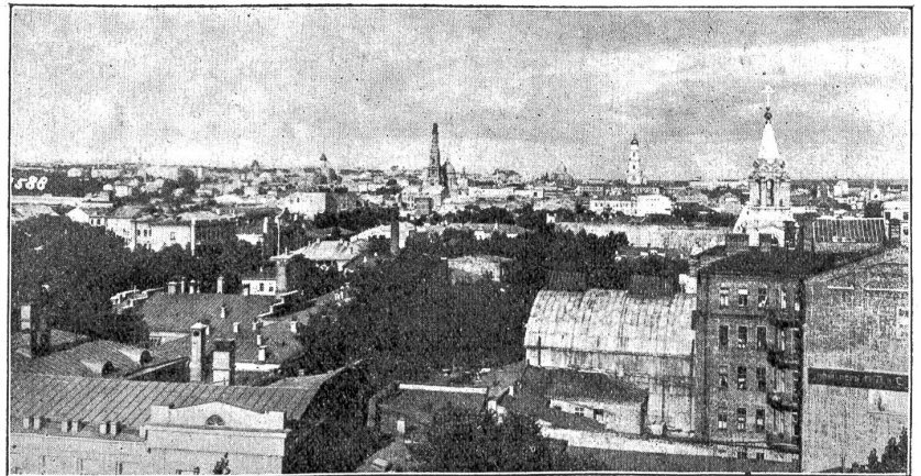
Aus der Ukraine: Blick auf die Universitätsstadt Charkow im Dongebiet.

Das Umschalten von einem zum andern Zählwert geschieht nun entweder durch Handumschaltung oder automatisch durch eine Umschaltuhr, die durch ein Hebelwerk beliebig eingestellt werden kann, ähnlich wie eine Weckeruhr. Die letztere Art ist die gewöhnliche. Die Doppeltarifzähler, die in Privathäusern zur Verwendung kommen, notieren also automatisch von 8—10 Uhr (im Sommer), bezw. von 1/24 nachmittags bis 10 Uhr nachts und 6 Uhr morgens bis