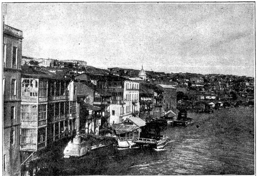
Partie an der Kura mit zahlreichen Wassermühlen.