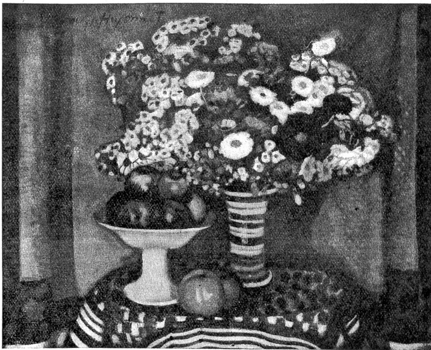
Aloys Hugonnet: Herbst.

„Und, wie geht's der Köchin?“ späßelte der Meister gutmütig und horchte dann ganz erstaunt auf: „Was, bei