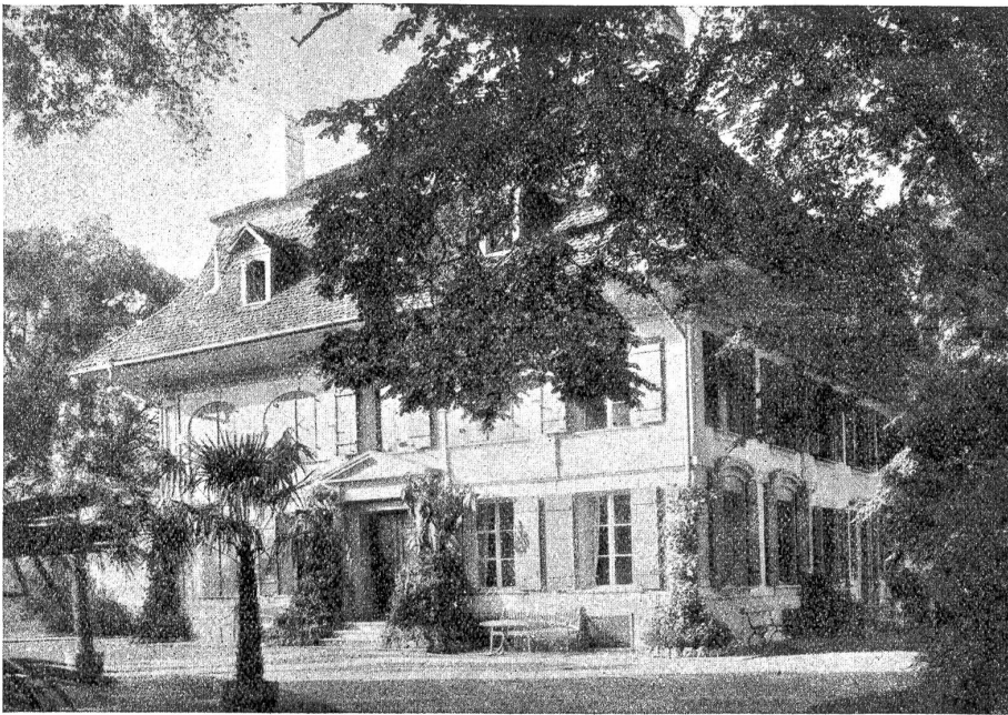
Das Herrschaftshaus in der Elfenau bei Bern.