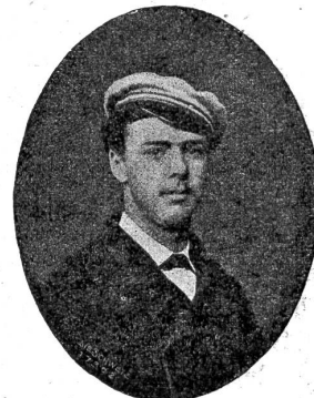
Hodler als Student.

Am Pfingstsonntag, den 19. Mai, starb in Genf an einem Nierenleiden im Alter von 65 Jahren und 2 Monaten