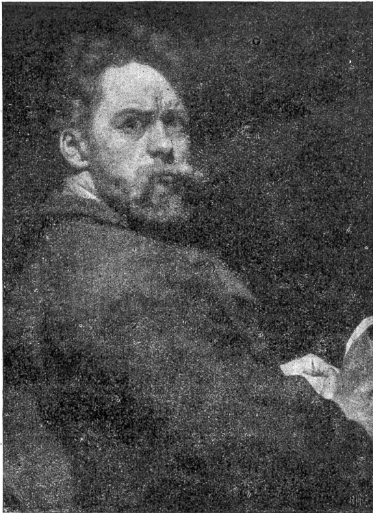
Ferdinand Hodler: Der Zornige. (Selbstbildnis von 1881 im Kunstmuseum Bern.)

Aber Adam ließ nicht ab, bis Martina trank, und das war eine gute Gelegenheit, daß Adam wieder ihre Hand faßte und dann Hand in Hand mit ihr weiterging.