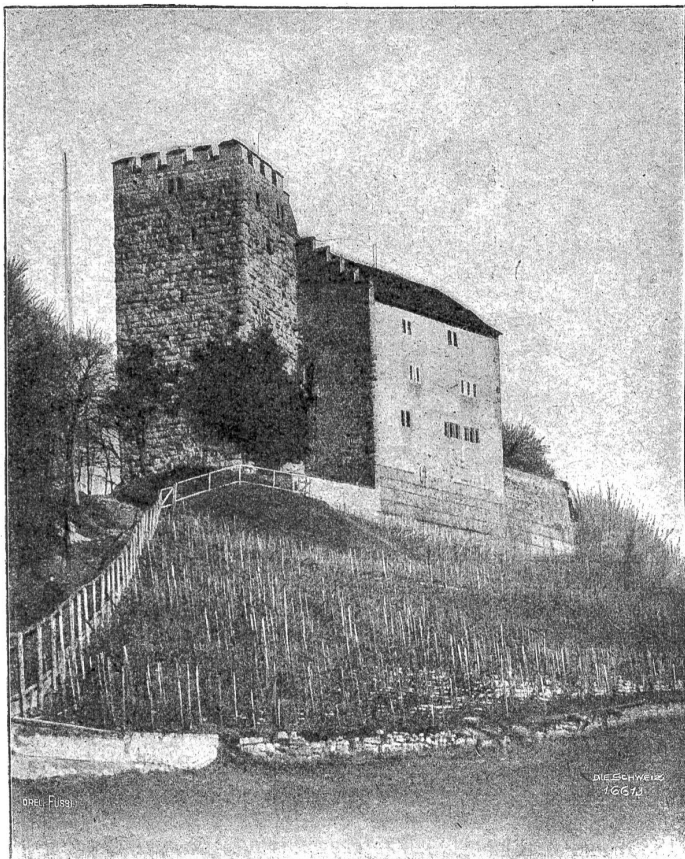
Die Habsburg, von Südwesten gesehen.

durch die Anwendung des Grundsatzes: „Divide et impera“. In einer ungarischen Hälfte beherrschte seit dem Ausgleich von 1869 die magyarische Minderheit (und innerhalb der Magnaten der Adel und die Hochfinanz) eine Mehrheit von Rumänen, Deutschen, Ukrainern, Serbo Kroaten und Tschechoslowaken. In der österreichischen Hälfte stunden Deutsche und Polen gegen Tschechen, Ukrainer, Slovenen, Italiener und Kroaten. In Bosnien eine römisch-katholische Minderheit, im Bunde mit dem mohammedanischen Großgrundbesitz zur Mehrheit geworden, gegenüber den Serbo Kroaten. In den einzelnen Landtagsversammlungen machte sich die Gruppierung gewöhnlich noch komplizierter. Die Folge dieser Zerrissenheit war eine Zunahme der Staatsohnmacht, worauf Serbien und das zarische Rußland zählten. Vielleicht wird einmal eine Statistik der Galgen von Bosnien und Galizien Aufschluß geben, wie weit diese Zersetzung schon fortgeschritten war. Franz Joseph starb in der trübsten Zeit des Nationalitätenhadens; das ist gewiß trotz allen damals angestimmten Lobfansaren; denn in jene Tage fallen die großen Ueberläufe der Tschechen ins russische und italienische Lager.