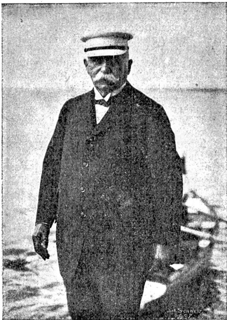
† Graf Ferdinand v. Zeppelin.

Graf Zeppelin ist am 8. März in Charlottenburg im 79. Lebensjahr gestorben. Sein Name bleibt mit der Geschichte der Luftschiffahrt für immer verbunden als Konstrukteur des nach ihm benannten starren Luftschiffstyps. Zeppelin machte i. B. den amerikanischen Sezessionskrieg mit und beteiligte sich 1866 und 1870 mit Auszeichnung an den Feldzügen.