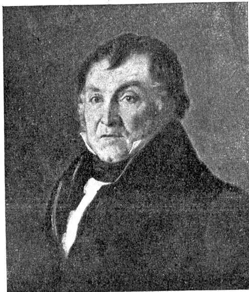
Karl Ludwig Stettler, 1773—1858.

Bürgerschaft u.“, als vielmehr darum zu tun war, „an den gastrischen Genüssen, und an den oft durch den dabei vorkommenden Witz sehr unterhaltenden Sitzungen theil zu