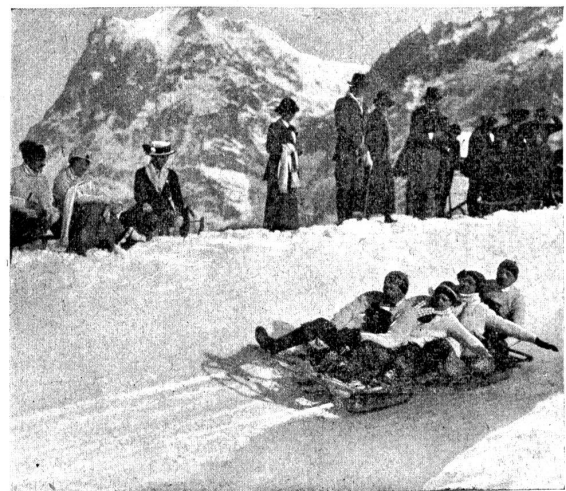
Schlittschuhsport bei Grindelwald.

Jedoch möchte ich dazu folgende Einschränkungen machen: Es ist nicht ratsam, daß kränkliche Leute das Schlittschuhlaufen noch lernen. Aller Anfang ist schwer und anstrengend: das gilt auch, wie jeder Eisläufer weiß, von dieser Frischluft- und Bewegungskur. Das Erlernen ist sehr ermüdend und greift die Körperkräfte ziemlich an. Daher soll man in gesunden Tagen, möglichst schon im Kindesalter, wo die verlorenen Kräfte schnell ersetzt werden und der Körper noch recht geschmeidig und gelenkig ist, sich den