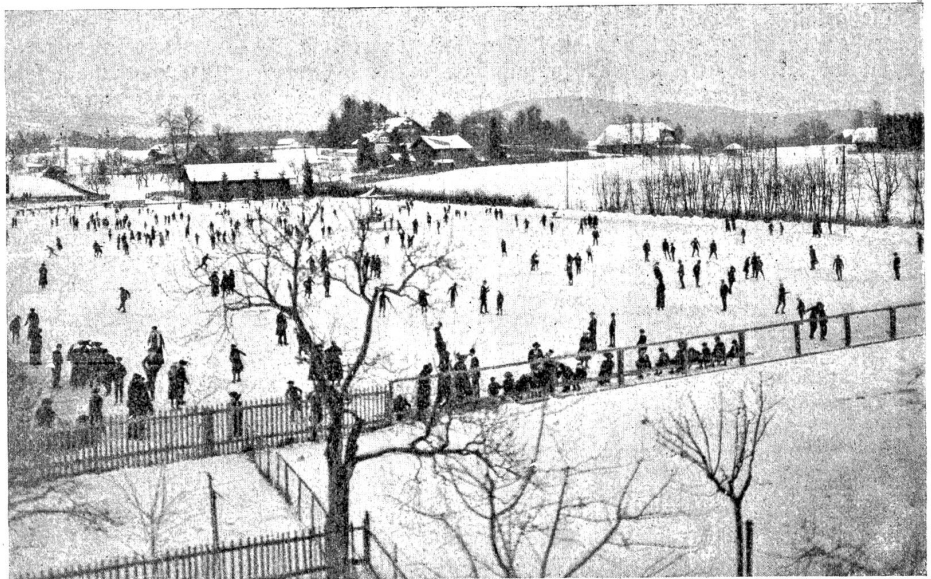
Schlittschuhsport auf dem Egelmöslli bei Bern.

Die Engelfinder sind schulpflichtig wie die Buben und Mädchen auf der Erde und müssen an den Wochentagen vormittags drei und nachmittags zwei Stunden in der Engelschule sitzen. Da schreiben sie mit goldenen Griffeln auf silberne Tafeln, und statt der Abcbücher haben sie Märchenbücher mit bunten Bildern. Geographie lernen sie nicht, denn wozu braucht man im Himmel Erdkunde, und das Einmaleins kennt man in der Ewigkeit gar nicht. Engel-schullehrer ist der Doktor Faust. Der war auf Erden Magister, und wegen einer gewissen Geschichte, die nicht