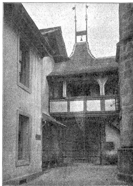
innenseite des Schlosshofes.

weise in ihnen Engel sah. Nun tritt sie in selbständige Aktion. Sie sucht ihre Programmpunkte zu ordnen, stellt sie dem Programm der bisherigen Parteien gegenüber. Und mit schmerzlichem Staunen erklären die bisherigen Führer: „Warum vertraut ihr uns nicht? Warum stellt ihr neue Programme auf? War es anfangs nicht so und so? Warum schwenkt ihr jetzt ab, da ihr doch so fest zu uns standet?“