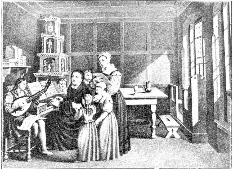
Luther im Kreise seiner Familie bei Frau Musica.