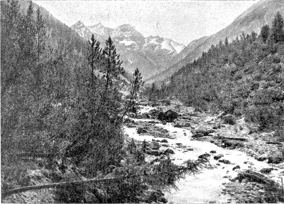
Aus dem Schweizerischen Nationalpark: Blick ins Val Cluozza, dem leichtest erreichbaren Teil des Parkes; der schäumende Bach im Vordergrund ergießt sich in den Spöl.

sie überschritten. Kleine Vogelspuren liefen wie eine zackig gegliederte Kette über den Weg und bald danach folgten die runden Spuren einer Raqe, die sich dahin geschlichen haben mochte, um den Frieden des Vögelchens zu stören. Eiszapfen hingen spitz und wasserklar an einem kleinen Brunnen, an den sich ein Gänsemädchen lehnte, ihre bronzenen Tiere tränkend. Die Sonne verwandelte die Eiszutropfen in Diamanten und Hates Nadel fiel Martin wieder