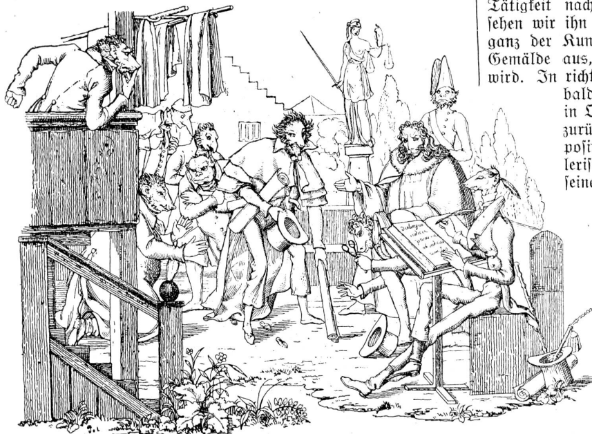
M. Disteli: Der Liebesmäntler. Der Fuchs verwedelt als Advokat die Spuren seines Veters.

Der junge Mann, der durch den Ersatz dieses seines ersten „öffentlichen Auftretens“ seinen Weg vorgezeichnet findet, ist kein anderer als Martin Disteli, geboren zu Olten im Jahr 1802. Er sollte sich dem Staatsdienst widmen und begab sich zur Vorbereitung auf seine zukünftige Tätigkeit nach Freiburg i. Br., dann nach Jena. Bald sehen wir ihn in der Münchener Akademie, wo er sich nun ganz der Kunst widmet. Dort führt er sein erstes großes Gemälde aus, das von der Kritik günstig aufgenommen wird. In richtiger Erkenntnis seiner Stärke entfagt er aber bald wieder der Palette und widmet sich fortan in Olten, wohin er als relegierter Burschenschaftler zurückgekehrt ist, beinahe ausschließlich der Komposition. In seinen Stoffen durchaus nicht wählerisch — er ist infolge ökonomischer Zerrüttung seiner früher gutsituierten Familie auf den Broterwerb angewiesen — zeichnet er Aushängeschilder, Schweizer Schlachten, Illustrationen zu Schweizer Zeitschriften und zu bekannten Werken. Seine Illustrationen zum „Münchhausen“ machen Aufsehen. Er macht sich mit gleichem Geschick an Bildzyklen (Heuschrecken). Einen geachteten Namen macht sich Disteli durch seine Zeichnungen zu den Fabeln des bekannten Schweizer Dichters Abr. Emanuel Fröhlich. Aber alle seine frühern Leistungen werden in den Schatten gestellt durch den seit 1839 herausgegebenen Kalender, der seinen Namen trägt und im ganzen Schweizerland großes Aufsehen erregt. Durch die geistreichsten und witzigsten