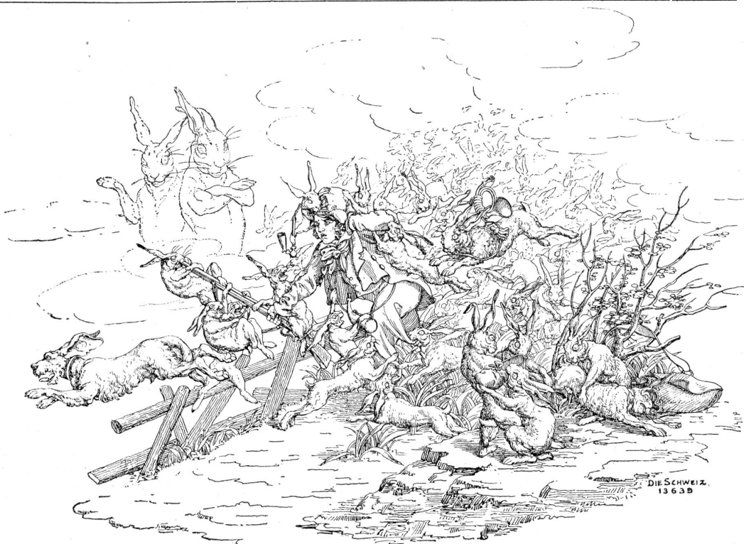
Martin Disteli: Der tolle Jäger. Die Hasen nehmen Rache an ihrem Verfolger und bringen ihn zur Verzweiflung.