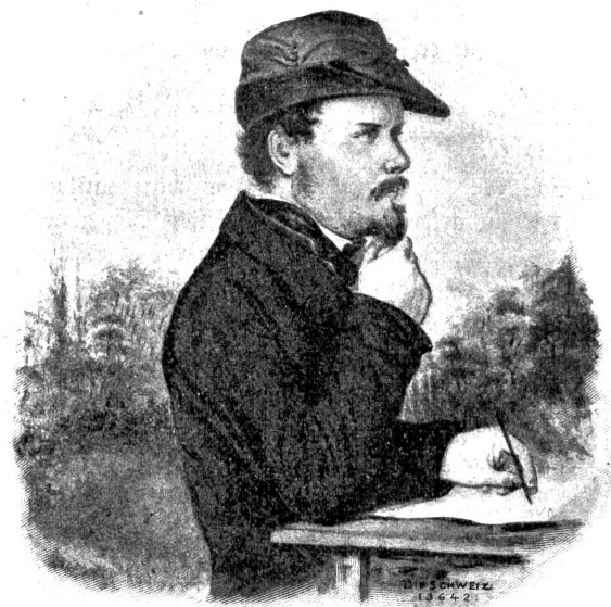
Martin Disteli: Selbstbildnis (Aquarell).