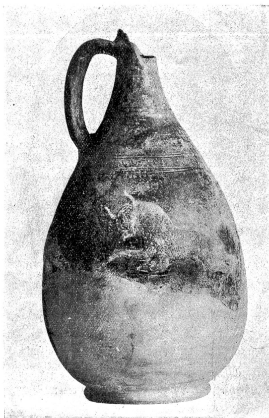
Fig. 4. Henkelkrug von Bipschal.

schnalle aus Eisen, welche als einzige Beigabe dem Toten ins Grab gelegt wurde.