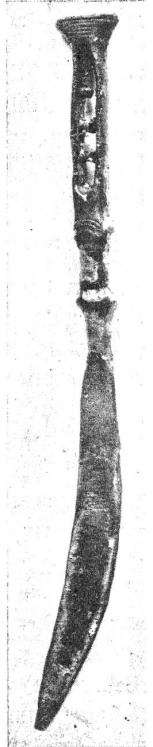
Fig. 2. Bronzemesser v. Schwarzenburg.

In die jüngere Eisenzeit gehören die Funde von Bümpliz. Bei der Ausbeutung einer Kiesgrube hinter dem Hause des Baumeisters B. Clivio kam ein Flachgrab zum Vorschein, in dem ein Skelett lag. An Armen und Füßen fand sich je ein Ring, die Fußringe mit Stößelschließe. Dieser Fund ist der erste eisenzeitliche in dieser Gegend. (Fig. 3.) Dagegen sind ähnliche Funde in der Stadt Bern gemacht worden. Wir nennen nur solche von der Schwarztorstraße, der Nyded, Schöthalde, Burgernziel, Spitalacker, Tiefenauhalbinsel, Zollikofen. Daraus geht hervor, daß in der jüngeren Eisenzeit, in welcher die Kelten unser Land bewohnten, eine starke Besiedlung vorhanden war. Caesar selber erwähnt, daß der keltische Stamm der Helvetier bei seiner Auswanderung 12 Städte und 400 Dörfer bewohnte. Zeugen davon sind hauptsächlich die Gräberfelder, von denen Münsingen das größte bekannte besaß. Von den Städten hat man nur die Spuren einer einzigen gefunden, derjenigen auf der Tiefenau. Dort fand man um die Mitte des vorigen Jahrhunderts massenweise Waffen und betrachtete die Tiefenau als ein helvetisches Schlachtfeld. Heute ist man zu der Ansicht gekommen, daß sich auf der dortigen Halbinsel eine helvetische Stadt befand, die vermöge ihrer Lage leicht zu verteidigen war.