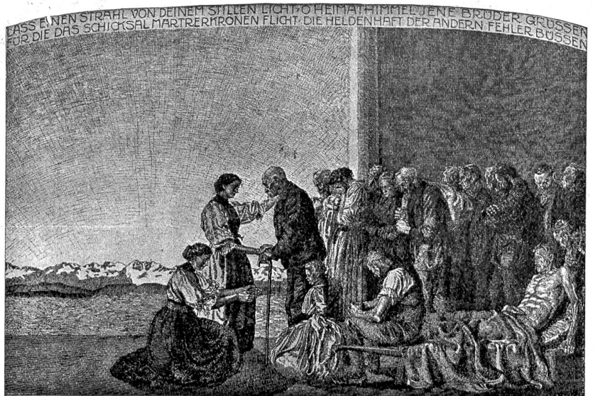
Die Schweiz und die Evakuierten im Jahre 1914/15. Nach einer Federzeichnung von Eduard Kenggli, Luzern.

Einige Tage darauf übergab mir Kaspar in unserer gemeinschaftlichen Kammer abends vor dem Zubettgehen ein zerknülltes, aufgeschnittenes Briefchen mit der Aufschrift: „An Herrn Bänder Sohn in Unterbuchen.“ Es sei jedenfalls an die unrechte Adresse gekommen, sagte er und grinste. Ich bekam ein schmales Blättchen Papier zwischen die Finger, das die kurze Notiz enthielt: