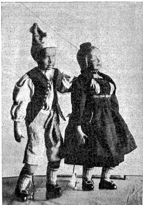
Vom Berner Puppenwettbewerb: Guggisberger Frauentracht. III. Preis.

vollendet will das Volk seine Puppen. Der Volksmund hat der Puppe (aus dem Lateinischen pupa = Mädchen, Larve,