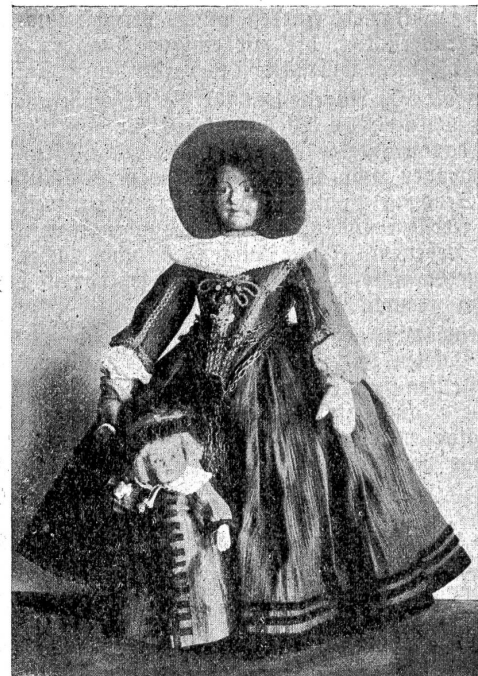
Vom Berner Puppenwettbewerb: Berner Kostümpuppe aus dem 17. Jahrhundert. II. Preis.

schon Holzköpfe der Ausstellung wurden in erster Linie für Trachtenfiguren hergestellt, daher der große Reichtum an prächtigen Trachten und Kostümen. Motive aus Kinderfabeln, originelle Komik, neumodische Auffassungen aus dem Kinderleben sollten entschieden noch mehr gepflegt werden. Schon das Wort „Puppe“ enthält die Grundelemente, die