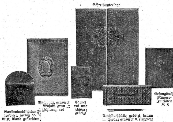
Schreibunterlage Buchhülle, graviert Mosaik, grau schwarz, rot Banknotentäschchen graviert, farbig ge- beizt, Rand gestochen Carnet rot und schwarz gebeizt Notizbuchhülle, gebeizt, braun u. schwarz graviert u. eingelegt Gesangbuch Münze- Initialen M S

Sophie Hauser darf wohl ganz zur Berner Kunstwelt gerechnet werden, wenn sie auch keine geborene Bernerin ist. Wer sich für biographische Notizen und für bestimmte Daten aus ihrem Kunstleben interessiert, findet solche im schweizerischen Künstlerlexikon und vor allem in einem demnächst zu erscheinenden, wertvollen Buche über künstlerische Frauenarbeit in der Schweiz. Wichtig zum Verständnis ihrer künstlerischen Arbeit bleibt, daß Fräulein Hauser ihre Schul- und Lehrzeit fast durchwegs in der Schweiz, an den kunstgewerblichen Anstalten von Bern und Zürich, bestanden hat und daß sie auf ihren Studienfahrten nach Paris und München auch manche gute Anregung in der Zeichnung und Malerei mit nach Hause gebracht hat, zwei Umstände, die für ihr ganzes künstlerisches Schaffen von wesentlichem Einfluß und von größtem Nutzen geblieben sind. Wir anerkennen hier mit Genugtuung, daß die Künstlerin vom ehrlichen Bestreben erfüllt ist, ihren Arbeiten nicht nur eine persönliche Note zu geben, sondern daß sie auch in ihren reiferen Werken versucht, ein nationales Gepräge zu verleihen. Kräftige, sparsam verwendete Ornamente, deren Anehnung in unserer Volkskunst wie in den Meisterwerken aus den Glanzzeiten einheimischen Kunsthandwerks leider vielfach noch so unerwartet brach liegen, kommen hier schon erfreulich zum Ausdruck. Die bei uns leider immer noch viel zu beliebte Anlehnung an deutsche und französische Vorbilder zu Ungunsten einer eigenen Tradition wird ebenfalls zu umgehen gesucht. Dabei