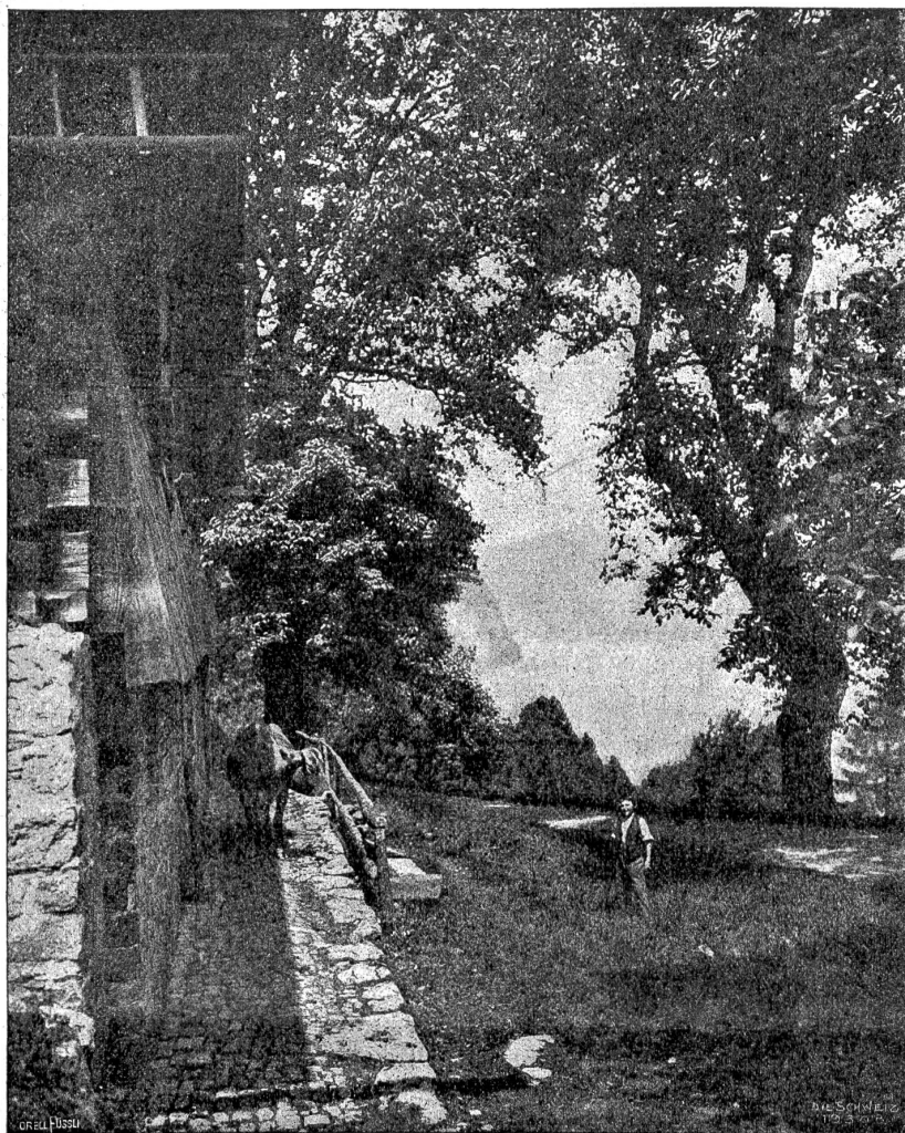
Auf dem Rütli.