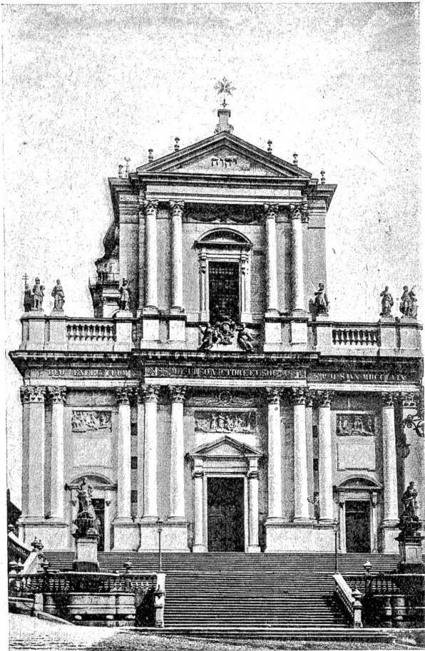
Das St. Ursusmünster in Solothurn (1765—1770).

Die St. Ursuskirche, das Wahrzeichen Solothurns, ist das Werk der Italiener G. M. und P. A. Piffoni. Sie ist das schönste Gebäude italienischen Stils, das die Schweiz besitzt. Eine monumentale Treppe führt zum Eingang empor. Die zweigeschossige Fassade mit ihrem antiken Giebel zeigt eine edle Gliederung in edlen Proportionen. Der zierliche Turm tritt gegenüber der aufzentuierten Fassade stark zurück. Das Innere der Kirche trägt den reichen Schmuck des klassischen Barock.