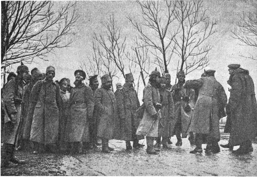
In der Winterschlacht in Masuren gefangene russische Offiziere, darunter ein Oberstleutnant und ein Oberst, bei Wilkowischki.

Wonne. Sie haben ihr Heim auf dem weiten Gefilde der benachbarten Trabrennbahn Ruhleben, wo sie sich aller Annehmlichkeiten erfreuen, die ein Mensch haben kann, dem nichts als die Freiheit fehlt. Hier wird mit dem Fußball ein wahrer Fetischdienst getrieben.