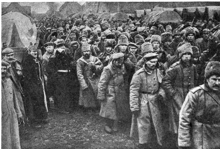
In der Winterschlacht in Masuren gefangene Russen während des Abmarsches.

Die Handwerker haben so ihren Stolz. Sie führen die Ahle, die Kelle, die Nähadel, den Brotbesen nur zugunsten ihrer Kameraden. Auf diesem Gebiet erweisen sich die Russen als die tüchtigeren Arbeiter. Für das verdiente Geld kann sich jeder kaufen was er mag und gezwungen zur Arbeit wird niemand. Darum sind die Angehörigen der Engländer nicht schuldlos an der durch Faulenzen hervorgerufenen Langeweile. Wenn nichts tun zu müssen Glück bedeutet, dann schwimmen die englischen Zivilgefangenen in