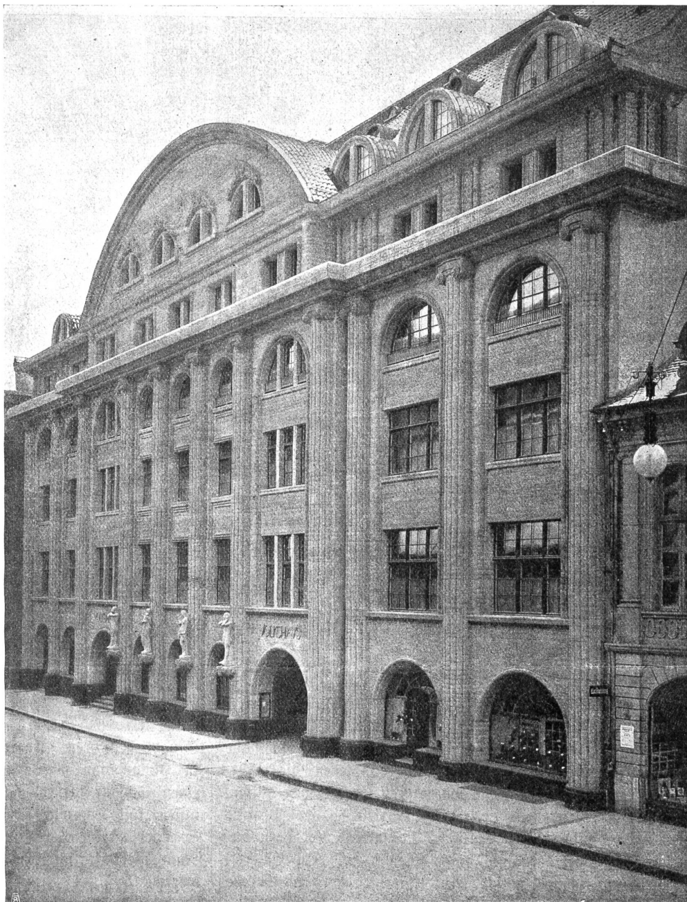
Volkshaus Bern, Sassade.

Bleich vor Zorn und Erregung las Jonas den Zweizeilenbericht seines Freundes. Mit einem Mal hob er den silbernen Briefbeschwerer auf und schmiß ihn in die schlanke Blumenvase, die alle Farben eines venezianischen Sonnenunterganges wiederpiegelte. Irmas Lieblingsstück, das sie von einer Schulreise aus Venedig heimgebracht hatte. Was sollte ein so duftiges, gedankenartiges Seelenaltärlein in einer so nüchternen Umgebung, in der inskünftig nur noch die schlaue, rücksichtslose Berechnung regieren sollte? Klirr lag das Farbenwunder in Scherben. Jonas aber schrieb einen Brief an die Wettbewerbsbehörde, in dem er geltend machte, daß in seiner Berechnung ein Irrtum unterlaufen sei, daß er sein Angebot um die Hälfte herabsetze. Er