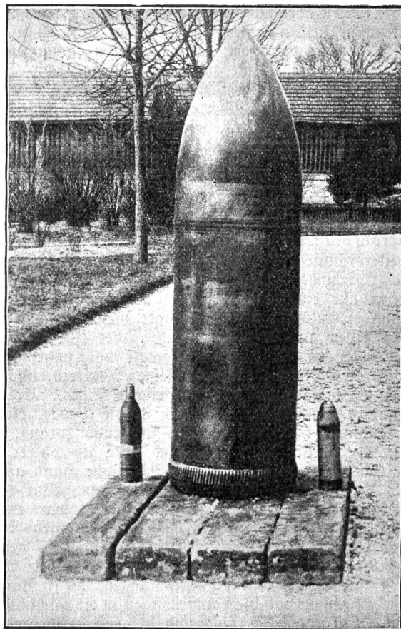
Ein 42-cm Geschöß der deutschen 42-cm Mörser, welches ohne zu krepieren, niedergegangen ist. Daneben steht ein französisches 7,5-cm Geschöß.

unsere Schulweisheit nichts träumen läßt. Der Teil ihrer Bewohner, der beim Schichtwechsel um die Mittagszeit die Werkstätten verläßt, überflutet im Nu die Straßen Essens mit einem unabsehbaren, schwarzen Gewimmel, durch das sich die Straßenbahnen nur mit ewig heiserer Glocke mühsam den Weg erzwingen. Ich sehe eine Frau unter die Räder eines Fuhrwerks kommen. Ein kleiner Kreis bildet sich um sie, die Massen wälzen sich aber hastig weiter, zu kostbar ist die Zeit. Hier wird jede Minute mit Gold aufgewogen wie draußen im Felde mit Blei. Die ruhigen Stirnen heben sich nicht zu dem diesigen Himmel, die müden Augen haben keinen Blick für die Romantik der Stahlzeit, die Ohren hören nicht die revolutionären „Schritte der Arbeiterbataillone“ — alt und jung strömt hinaus in den Frieden vor den Toren, in die Blumenidyllen der Heimstätten, die ihnen der Mann geschaffen, der vor seine Tat das Wort stellte „Der Zweck der Arbeit soll das Gemeinwohl sein“. Mit den Gehenden mischen sich die Kommenden, Essen kennt keine träge Mittagsruhe. Ich tauche mit ihnen unter in das brüllende, heulende, stampfende und dampfende, dröhnende, stöhnende Chaos des maschinenerfaßten Eisens, in den herrlichen Feuerzauber unserer Tage, in das Schattenreich der Kohle. (Schluß folgt.)