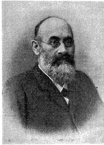
† Joos Cadisch.

Cadisch Abschied genommen, als am Nachmittag des 26. Januar, nach abgehaltener Trauerfeier in der Kapelle des Bürgerspitals, der mit reichen Blumengebirgen bekränzte Sarg im Glanze der sinkenden Winter Sonne seinen Weg