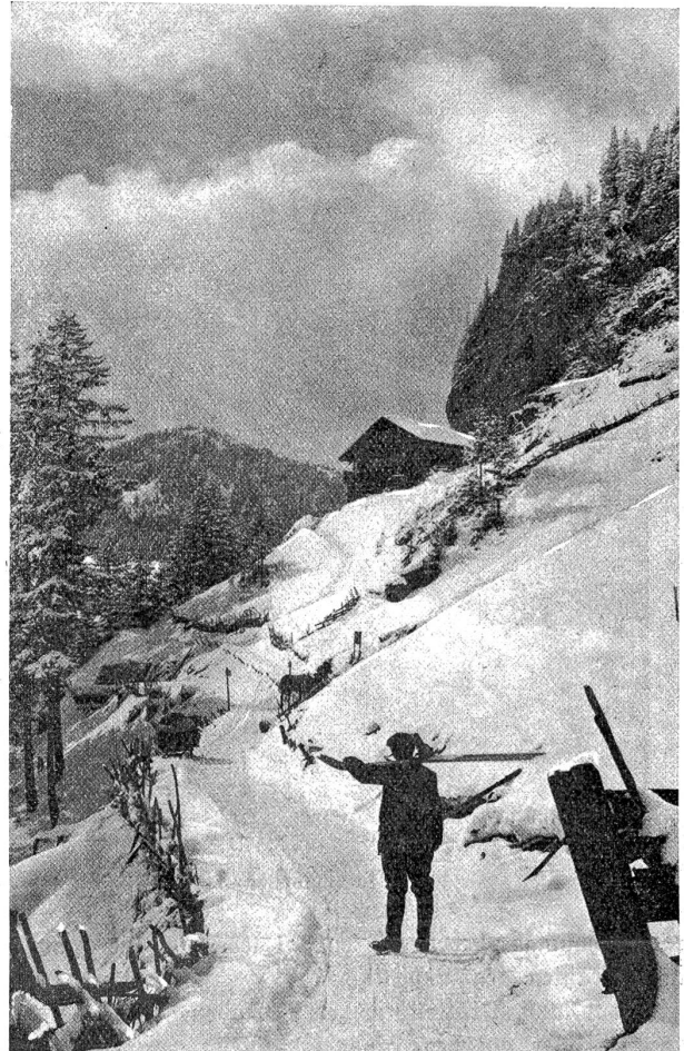
Unter der Stuh bei Adelboden