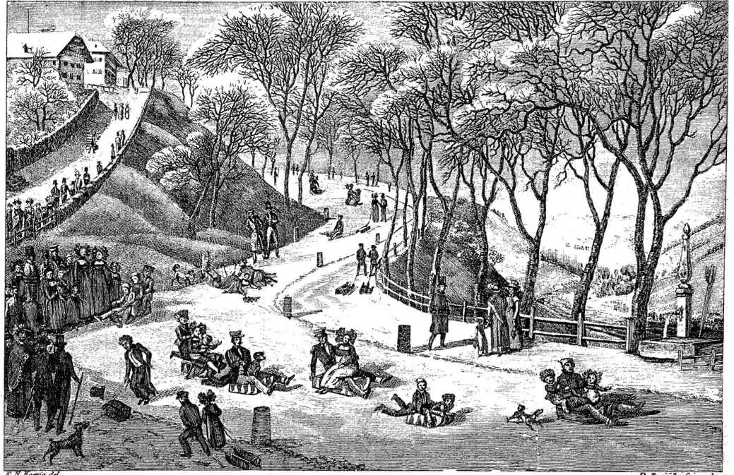
Das Schlitteln am Bierhübelstutz um das Jahr 1827. (Nach einer Zeichnung von S. R. König)

si de Wachscherze gteett und gfarbeti Papierböge drum tha und de hei die Papane mit dene Mamene afa schlittle, daß es e Freud gfi Ingi. Nache hei si de bim Bierhübelwirth no e warmi Tasse Thee oder e heiße Grogg gno und hei de im Heicho bim Zuderbed Bän a der Narbergergaß, bim Pastetebed Chuenz am Wyhermärit oder bim länge Herr Wenger oder bim Calame, wo beid a der Chramgaß In gfi, es Paar Schmelzbrödtli, das ist e so es Chindergüezi gfi, g'hauft, um se dene Chinde, wo sider lieb In gfi und schön gfolget het, hei z'hrame. Der Gusti het di meiste übercho, i ha längs Zyt nid gwüßt was d'Schmelzbrödtli für ne Chust het.