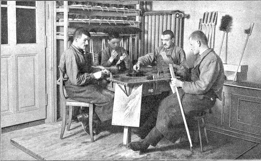
Blindenheim an der Neufeldstrasse: Pecherei in der Bürstenfabrikation.

Langsam und schwerfällig verließen drei hungrige Eisbären den Bivakplatz*). Rings lag tiefer, tiefer Schnee und der Sturm trieb mit ihm und mit uns sein wildes Spiel.