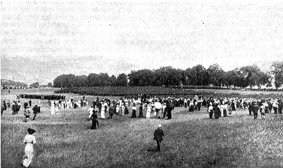
Der Fahneneid der Berner Truppen auf dem Wankdorffeld am 5. August 1914.

Und neben dem greisen Mann das kleine greise Mütterchen. Sie hat diesen Sohn mit unsäglichen Schmerzen geboren, hat ihm unzählige Nächte gewacht, hat um sein zartes Leben gebangt so manches, manches Mal. Wie stolz hat ihr Herz gepocht, jedesmal, wenn ihr großer, starker Sohn nach glücklich bestandnem Examina heimkam und wie er erstmals