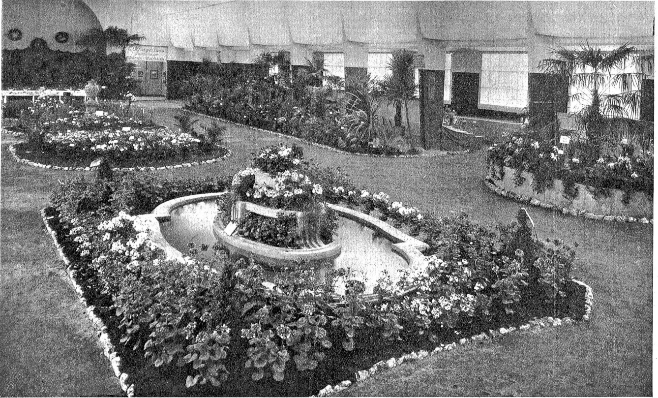
Schweizerische Landesausstellung in Bern: II. Temporäre Gartenbau-Ausstellung.