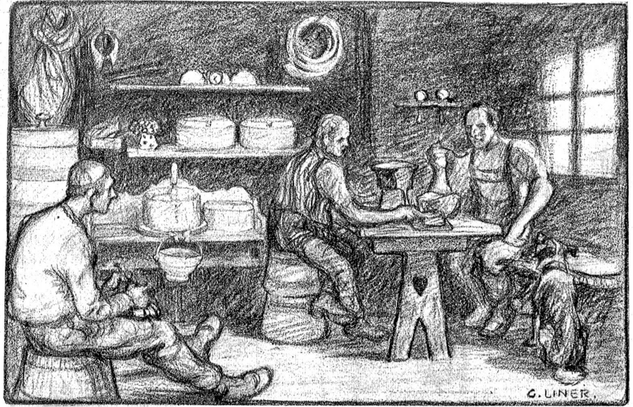
„Appezeller Sennelebe.“ (Zeichnung von C. Liner.)

Mit dem Jauchzen vermischten sich alsbald die dumpfen Töne der Senntumshellen.