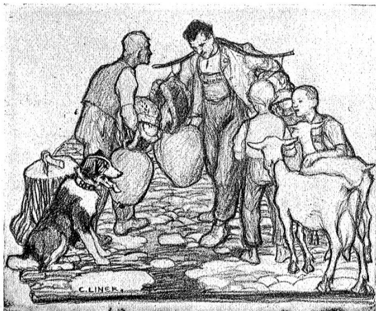
„Appenzeller Senneliebe.“ (Zeichnung von C. Linder.)

Silberknöpfen, welche in zwei Reihen die roten, offenen Brusttücher*) zierten.