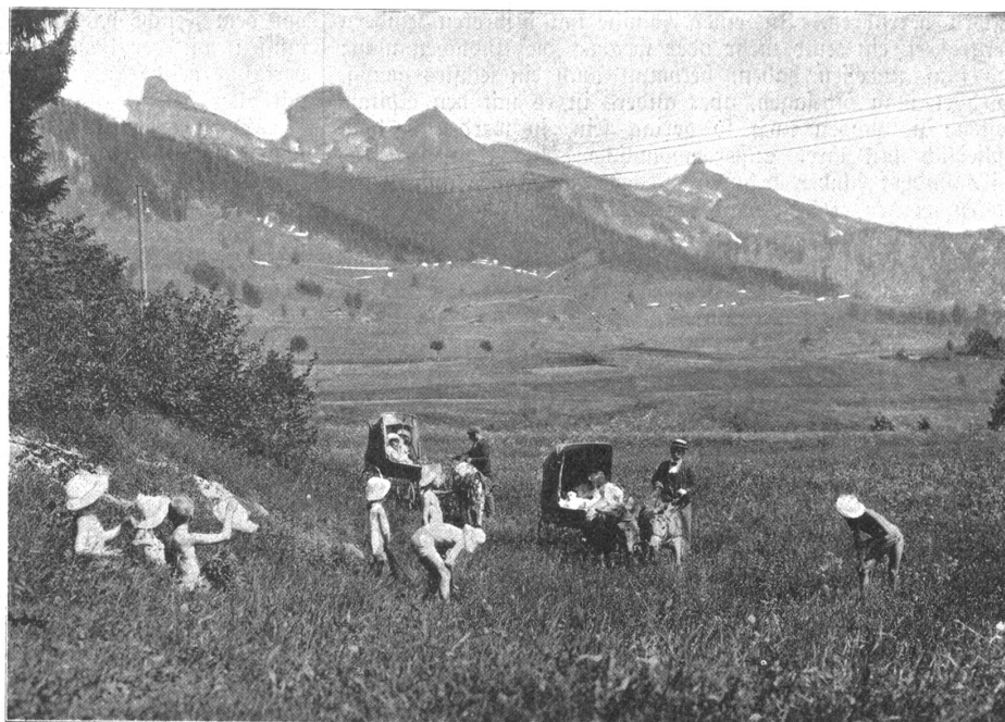
Sommerleben genesener Kinder in Leysin.

Ich habe Ihnen bis jetzt in großen Zügen die mannigfaltigen Kampfmittel bezeichnet, über die wir bei dieser schrecklichen Krankheit verfügen. Ihre Wirksamkeit steht über allem Zweifel; deshalb müssen sowohl Ärzte wie Kranke begreifen, daß in den meisten Fällen eine andauernde Heilung zu erreichen ist, wenn nur bei Zeiten darauf hingearbeitet wird. Der ungeheilte Knochentuberkulose ist für seine Umgebung ebenso gefährlich, wie der Lungenkranke. Wir müssen also unsere Kräfte so bald als möglich zusammenfassen, um dieser Form von bazillärer Infektion zu begegnen. Es ist sehr zu bedauern, daß die lange Dauer der Krankheit große, oft unüberwindliche Opfer an Zeit und Geld erheischt. Deshalb