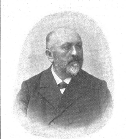
† Dr. med. Ernst Ringier.

Einfluß des Geistes auf den Körper“. Auch eigene Erzeugnisse hat er auf den Büchermarkt gebracht und schöne Anerkennung gefunden mit