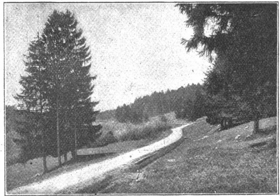
Wald und Weiden auf dem Tessenberg.

„Du weißt es ja, ich kann von Vaters Glauben nicht lassen.“ „Ich habe dich lieb, so wie du bist, Maria!“