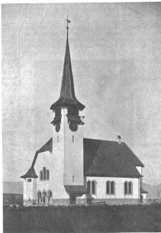
Die neue Kirche von Biberist-Gerlafingen.

Die drei bernischen Irrenanstalten bei Herberghen am 31. Juni 1913 insgesamt 1841 Kranke, nämlich Waldau 686, Münstingen 827 und die Anstalt Bellelay 328 Kranke.